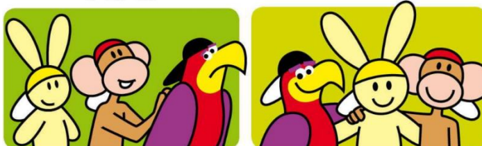
'Wij gaan even wat anders doen, laat konijn maar met rust', zegt aap.